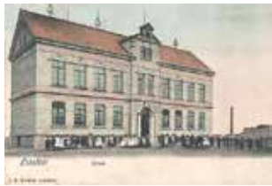
um 1910