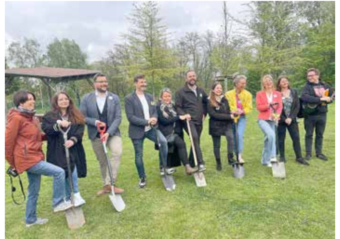
Das Team der Grundschule Lobstädt

Tombola organisiert, bei der zahlreiche attraktive Gewinne lockten. Der tatkräftige Einsatz aller Beteiligten zahlte sich aus: Die Tombola war restlos ausverkauft und erzielte einen erfreulichen Erlös für zukünftige Projekte der Schule. Ebenso fand die Verpflegung mit selbst gebackenem Kuchen und den frisch zubereiteten knusprigen Pommes großen Anklang. Die Projektwoche war für alle Kinder eine bereichernde Erfahrung, bei der sie viel Neues lernten, kreativ arbeiteten und ihre Ergebnisse mit Stolz präsentieren konnten.