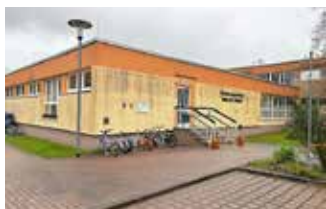
„Fassade seit 2000er Jahre“