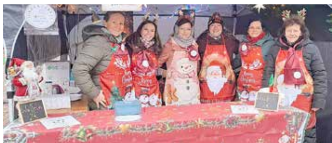
Die Vorstandsmitglieder des Fördervereins „Zukünftige Entdecker Neukieritzsch e.V.“